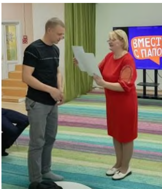
Вручение грамот с конкурса «Каждой пичужке наша кормушка»