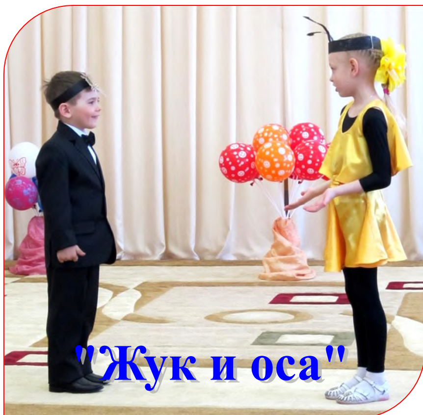
"Жук и оса"