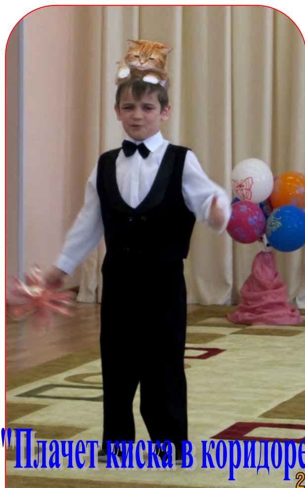
"Плачет киска в коридоре"