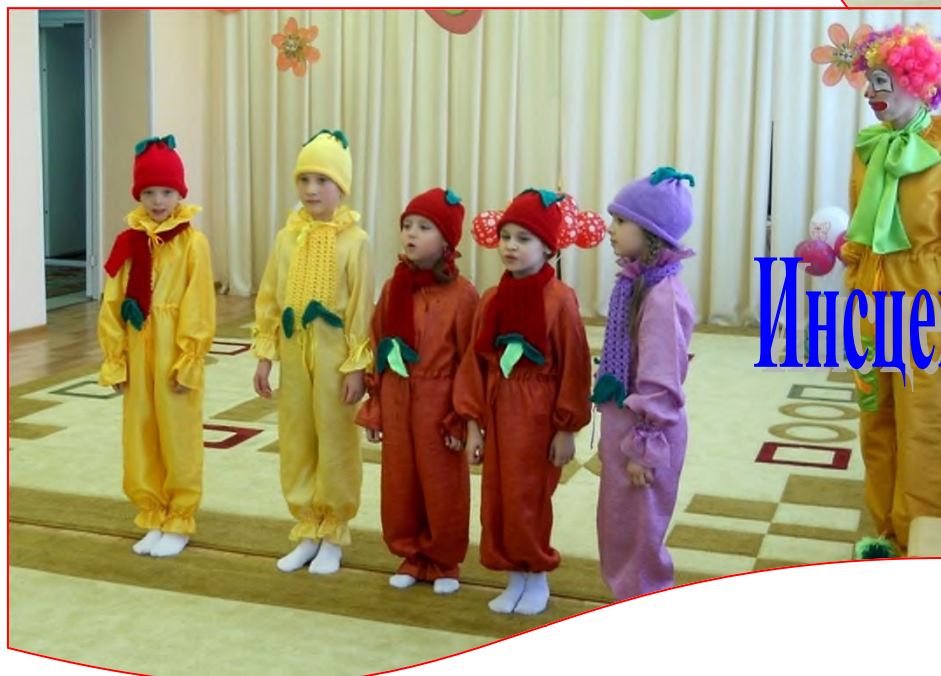
Инсценирование сказочки «Фруктовая»