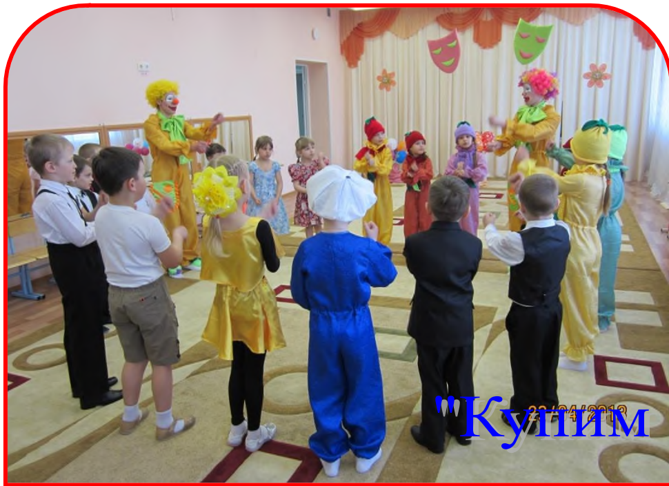
Игра "Купим мы бабушке"